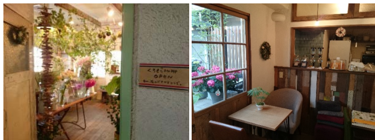
※西荻窪店舗写真イメージ